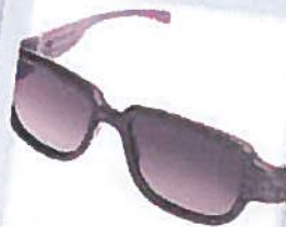
VICTOR & ROLF GROUPE PAGET

Le bois, pour affirmer sa personnalité «éco-chic» c'est l'idéal ! Les lunettes en bois sont très agréables au toucher mais elles sont un peu plus fragiles que les autres et sont donc à manier avec délicatesse.